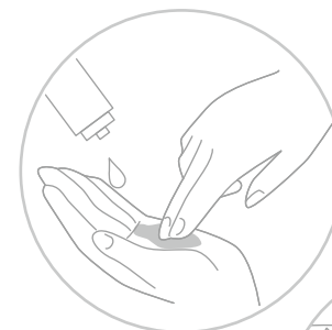
歯ぐきへの塗布も